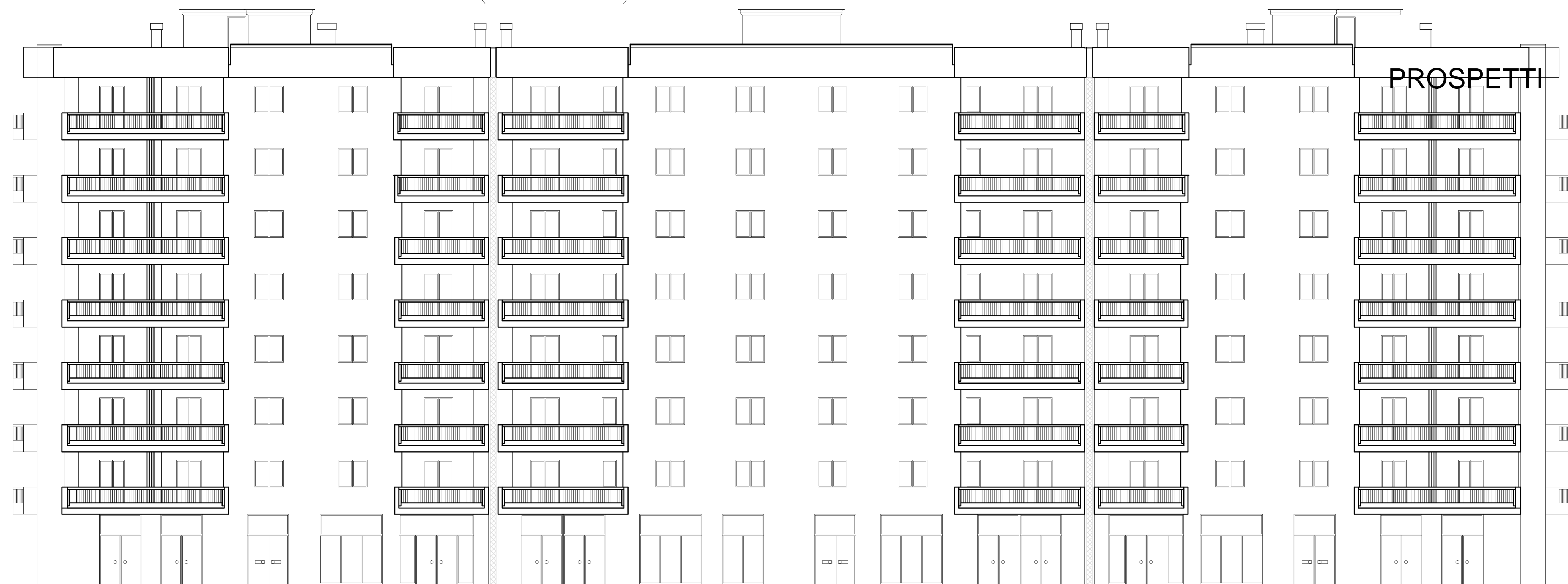
PROSPETTO SU PIAZZA ALDA MERINI (SUD-OVEST)