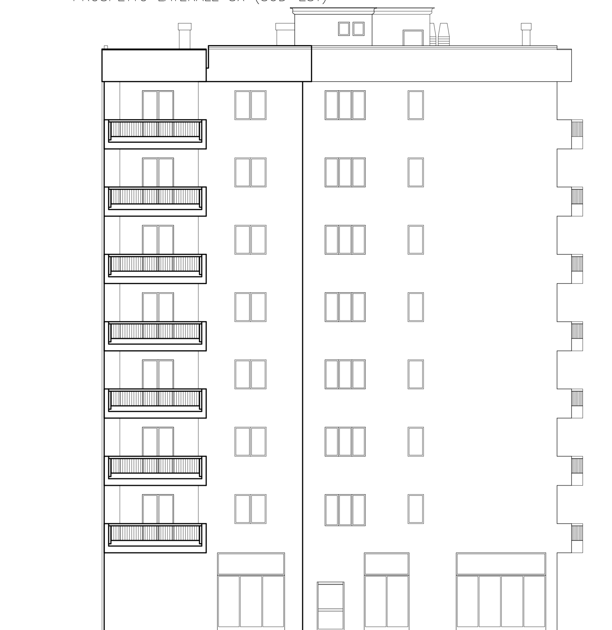
PROSPETTO LATERALE SX (SUD-EST)