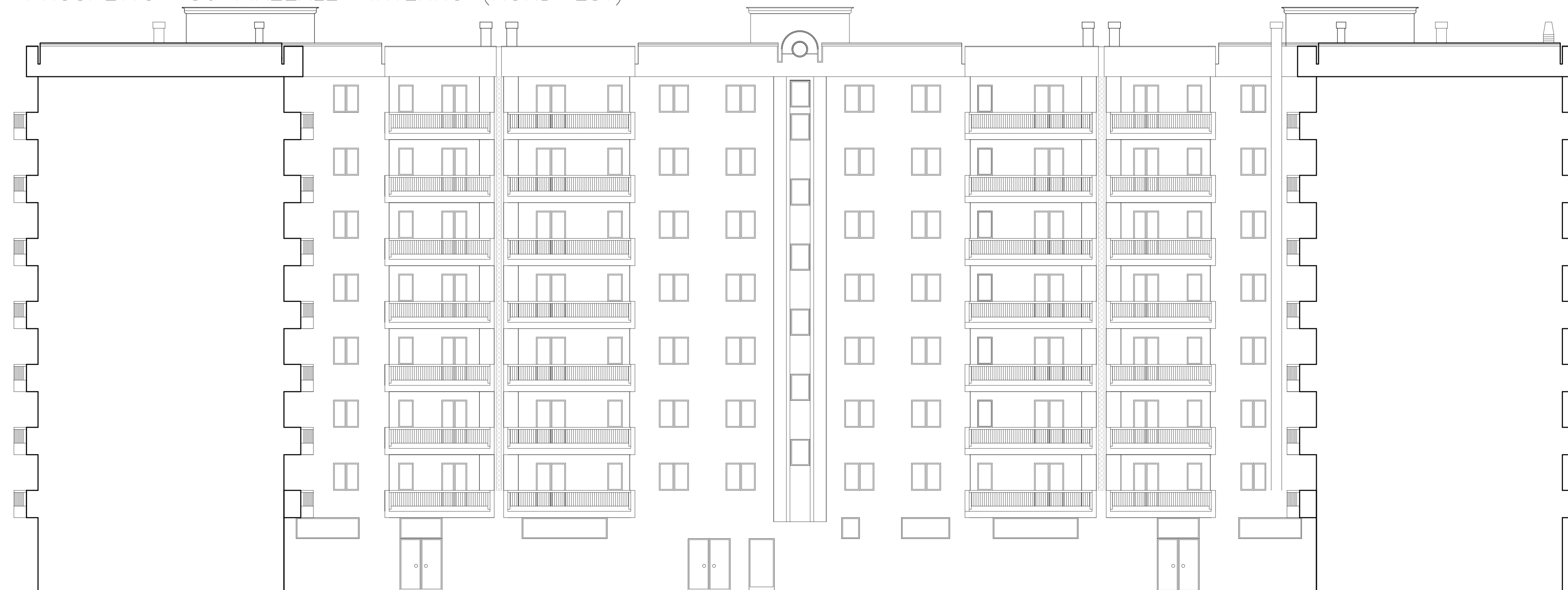
PROSPETTO SU PIAZZALE INTERNO (NORD-EST)